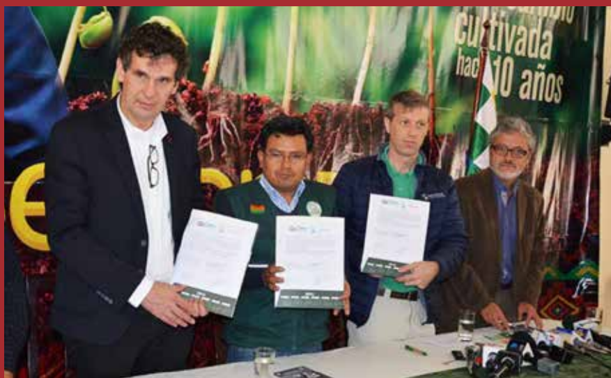
Foto. Firma del convenio entre ACCESOS y HELVETAS Swiss Intercooperation

El programa ACCESOS del Ministerio de Desarrollo Rural y Tierras, el FIDA y el proyecto de Reducción del riesgo de desastres de la Cooperación Suiza, ejecutado por HELVETAS Swiss Intercooperation, firmaron un convenio específico de cooperación interinstitucional.