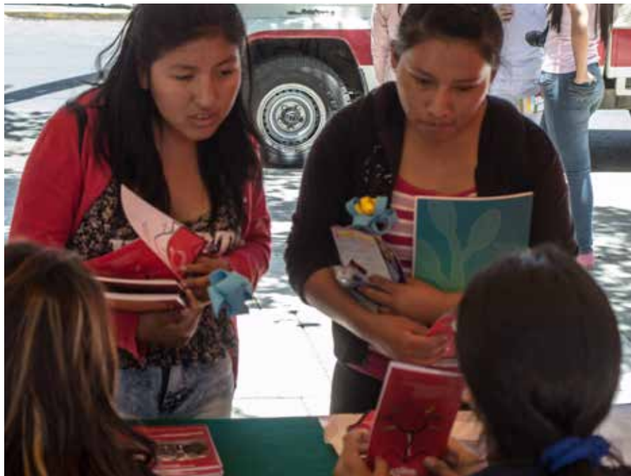
Foto. Estudiantes universitarios reciben material e información sobre Reducción del riesgo de desastres y Adaptación al cambio climático