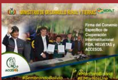
Ministerio de Desarrollo Rural y Tierras