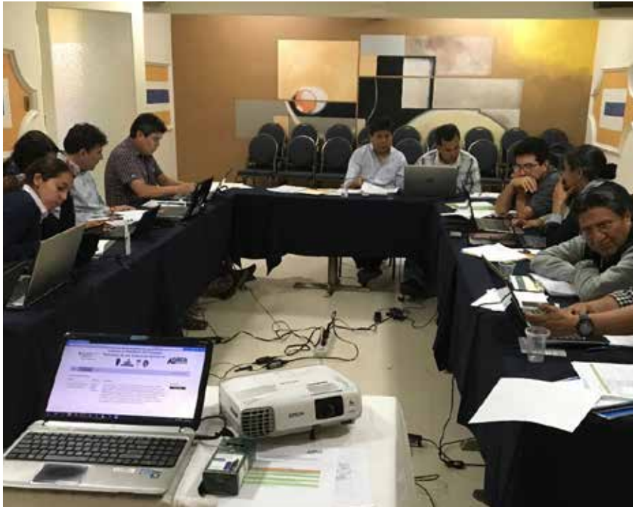
Foto. EGPP implementa la certificación en Gestión del riesgo de desastres y Adaptación al cambio climático