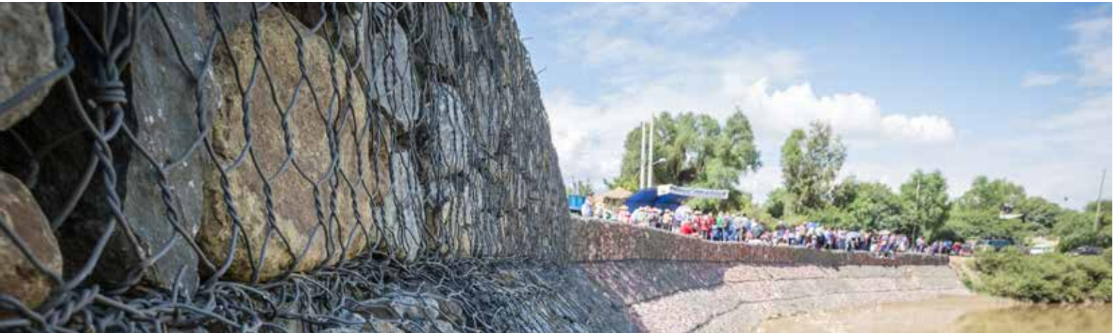
Fotografía: Muro de gaviones resiliente - Vinto, Cochabamba

----Reducimos el riesgo, enfrentamos el cambio climático----