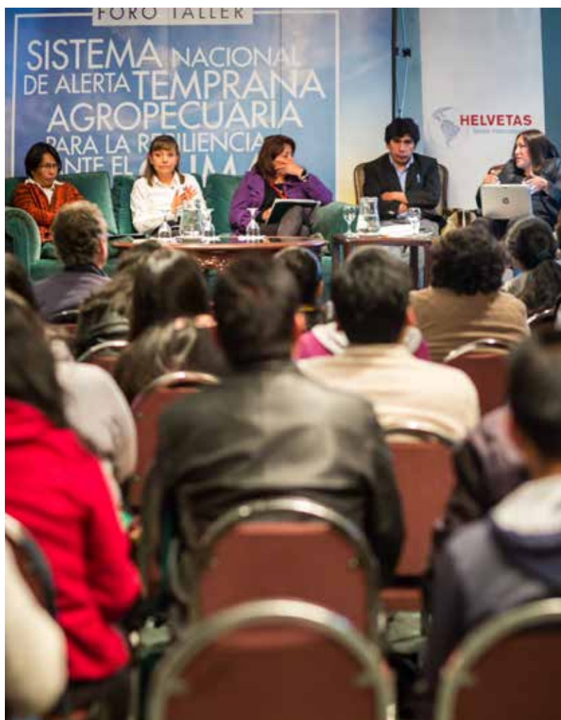
Foto. Expertas nacionales e internacionales hablan sobre Alerta Temprana Agropecuaria - La Paz