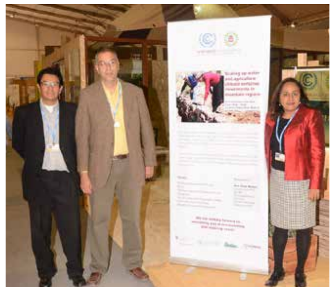
Foto. Representantes de HELVETAS SI en Marrakech

Por su parte, HELVETAS presentó el “escalamiento de inversiones sensibles al clima en agricultura y agua en regiones de montaña” con el afán de compartir experiencia práctica, herramientas y políticas que podrían ser replicadas en otras regiones de montaña. (COA)