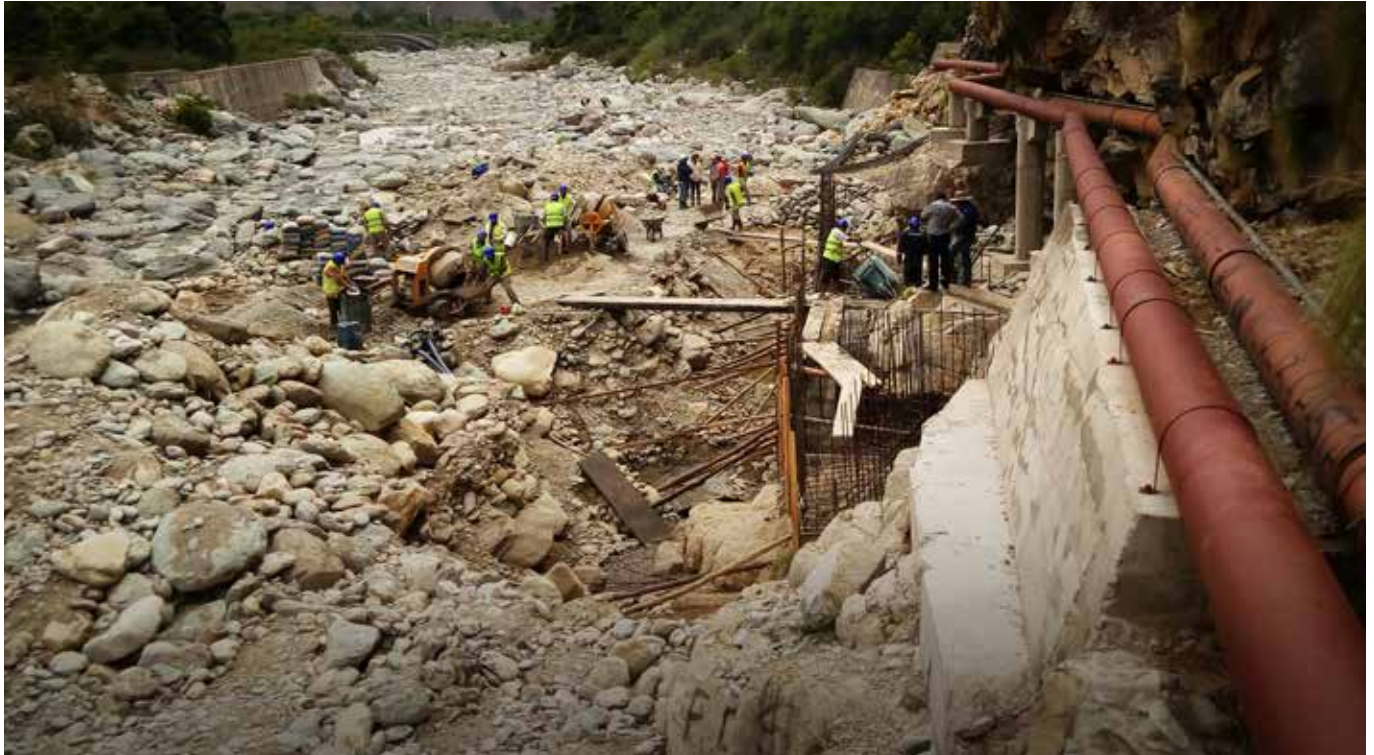
Foto. Construcción de defensivo de hormigón armado que protege de las crecidas del Río Sola a las tuberías que alimentan el sistema de riego Bella Vista

Costos evitados: El proyecto de riego de Bella Vista llevó la teoría a la acción