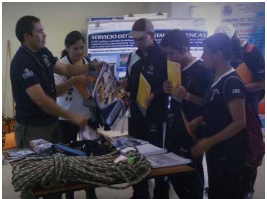
Foto. Estudiantes de la Universidad Católica de Cochabamba aprenden sobre gestión de riesgos gracias a la Unidad de Gestión de Riesgos de la Gobernación cochabambina