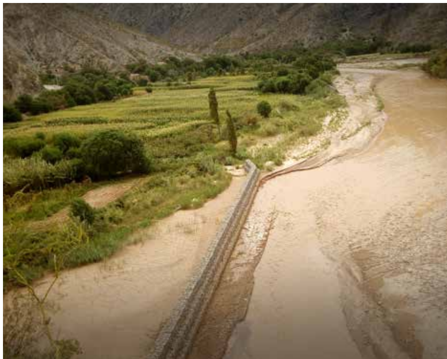
Foto. Defensivo de gaviones que protegerán las parcelas y el sistema de riego de la Comunidad de Atacama frente a las crecidas del Río San Juan del Oro

El proyecto de riego de Atacama en el Municipio de Yunchará identificó medidas de resiliencia utilizando métodos desarrollados por el PRRD