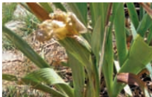
1ra floración. Desde el 22 de octubre.

La primera floración duró sólo un día, lo que significa que la primera siembra no será buena.