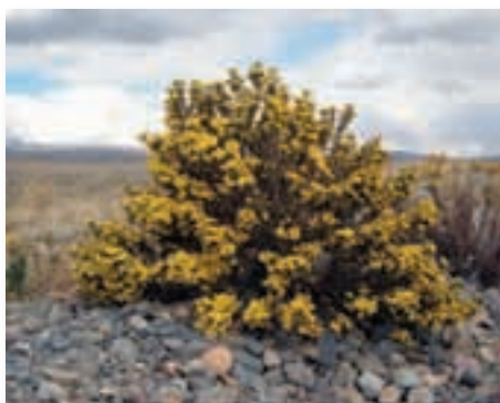
Mes de diciembre, del 4 al 10. 3ra floración.

En cambio, la tercera floración que tuve fue muy buena y duró tres semanas, lo que significa que en la tercera siembra la producción será mejor que en las anteriores.