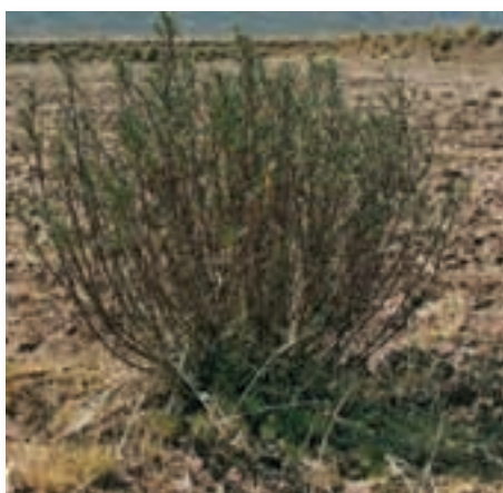
Mes de junio. 1ra floración.

Mi primera floración fue buena, pero la helada era muy fuerte y quemó las flores. Eso significa que la primera siembra no será buena para ustedes.