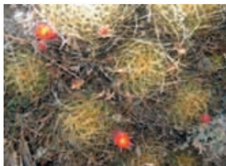
3ra floración y fruto

Mientras que en la tercera floración mis flores fueron muchas y no les afectó la helada, además mis frutos fueron grandes, lo que quiere decir que en la tercera siembra habrá buena producción.