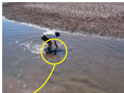
Lugar donde he colocado mis huevos.

Cuando deposito mis huevos, primero observo dónde puedo colocarlos. Este año yo los coloqué al centro del río. La razón es porque no va a caer mucha lluvia y para que vivan mis hijitos necesito que estén permanentemente en el agua, entonces el centro es el lugar más apto porque es el más profundo.