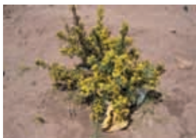
Del 10 de septiembre al 12 de octubre. 2da floración.

La segunda vez florecí de mejor manera, lo que indica que la segunda siembra será normal.