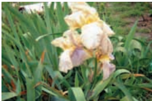
2da floración. Desde el 29 de octubre.

La segunda floración ha permanecido durante tres días aproximadamente. Con eso les indico que la segunda siembra será mejor que la anterior.