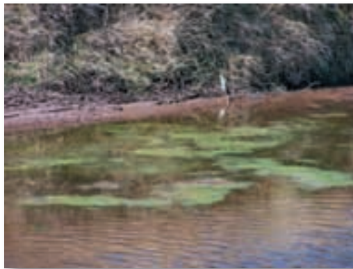
Agua sucia o turbia.

También hay que observar la cantidad de algas, si estoy bien maduro significa que la producción será buena. Este año ha sido así, bien maduro me he formado.