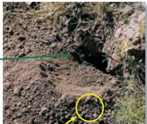
Grumos de tierra como confite

Esta vez yo hice mi casita entre la loma y la pampa, lo que significa que este año la lluvia será muy escasa.