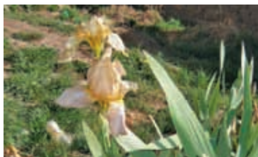
3ra floración. Desde el 2 de diciembre.

Mientras que la tercera floración duró una semana entera, por eso la producción de la tercera siembra resultará mucho mejor que las otras dos.