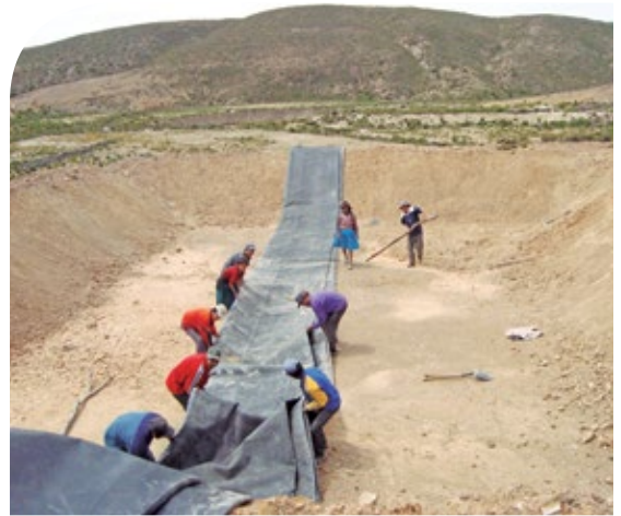
Foto: Construcción de atajado en Cotagaita.

Hasta diciembre de 2013, en el marco de los proyectos demostrativos, se deben ejecutar algunas de las siguientes obras: atajados, sistemas de cosecha de lluvia, protección de fuentes de recarga de acuíferos, sistemas de riego para enfrentar la falta de agua; defensivos contra riadas y mazamoras, rehabilitación de suelos productivos y la instalación de estaciones meteorológicas.