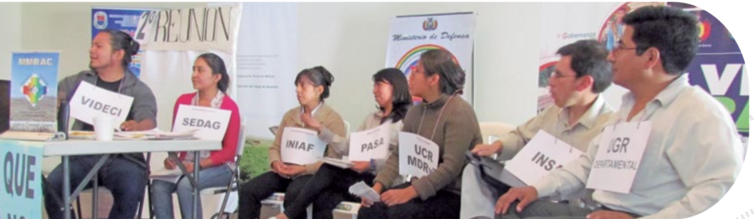
Foto: Región Andina representa el proceso de conformación de sus UGR mediante la articulación de actores.

----- Reducimos el riesgo, enfrentamos el cambio climático -----