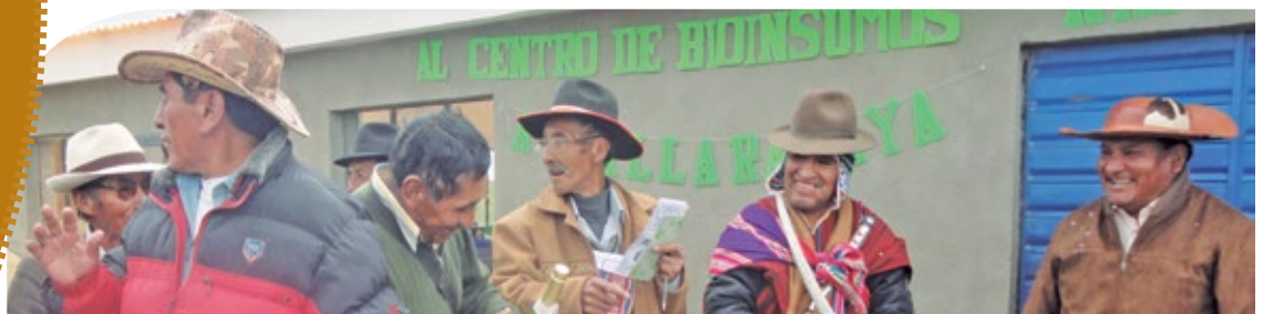
Foto: Centro de bioinsumos en Kallaramaya, municipio de Caquiaviri.

Agricultores y sus organizaciones locales de La Paz, Oruro, Potosí y Chuquisaca implementan los denominados "servicios productivos integrales" financieros y no financieros, en puntos clave de sus territorios, como medidas para gestionar y transferir el riesgo de desastres de origen natural.