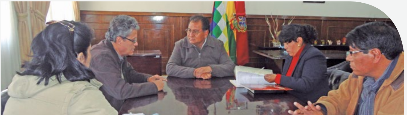
Foto: Firma de convenio con la Gobernación de Oruro en el marco del PRRD.

Entre abril y agosto de 2013, el PRRD firmó acuerdos con las gobernaciones de Oruro, Chuquisaca y Potosí para el fortalecimiento de la gestión del riesgo de desastres que incluye, fortalecimiento de capacidades, asistencia técnica e instrumentos de Reducción del Riesgo de Desastres (RRD) y Adaptación al Cambio Climático (ACC).