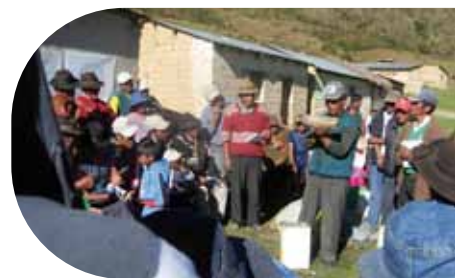
Líder productivo socializa su experiencia a comunidades nuevas del Jacha Suyu Pakajaqi

ramientas de gestión de información y planificación productiva en los diferentes niveles; finalmente, se implementarán microseguros que permitirán a los actores contar con condiciones para una producción agrícola sostenible y resiliente. Estas acciones serán contribuciones importantes al desarrollo en los niveles subnacional y nacional, en el marco de las actuales leyes.